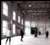
THE SAVAGE FIVE