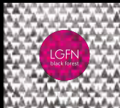
LGFN | LE GÂTEAU FORÊT NOIRE